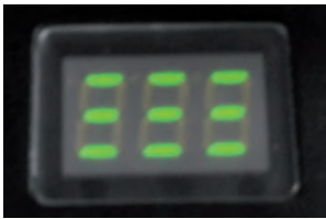
Kühlzeit läuft (2 Minuten)