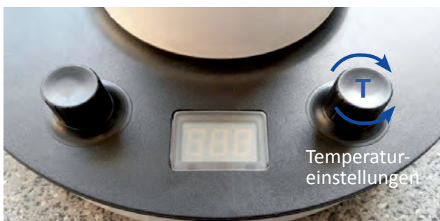
Funktion der Drehwähler

Mit dem rechten Drehwähler (T) kann die Temperatur eingestellt werden. Das Gerät übernimmt die gewählte Temperatur nach ca. 5 Sekunden.