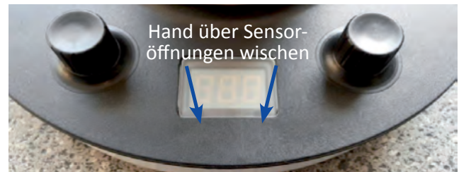
Bedienung des Sensors

Das Gerät kann über einen optischen Sensor wieder eingeschaltet werden. Hierzu muss einmal mit der Hand über das Display „gewischt“ werden (siehe Video).