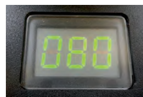
Display mit Anzeige der Temperatureinstellung